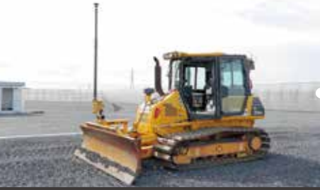
ローラ締固め管理