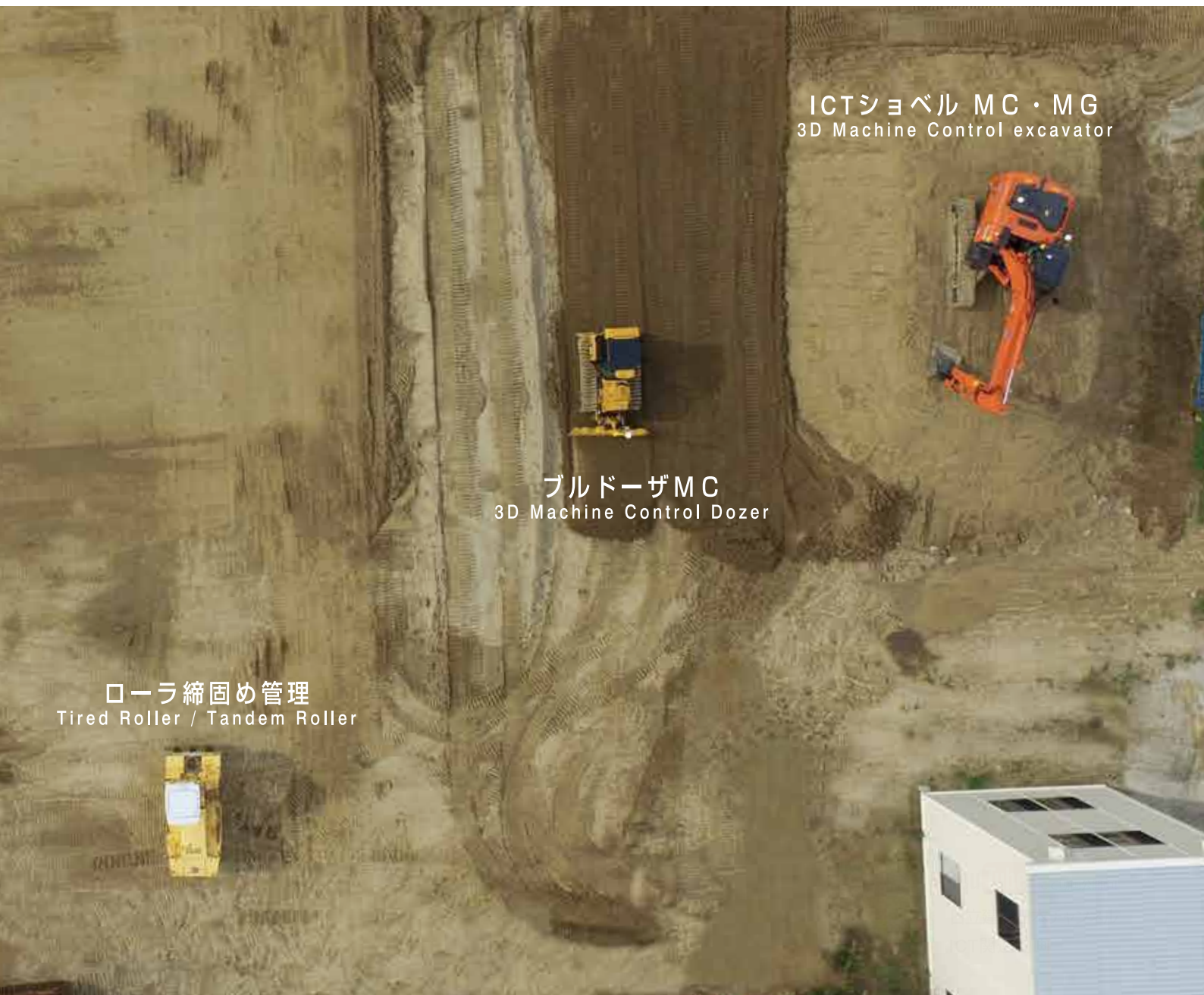
ICTショベル MC・MG 3D Machine Control excavator