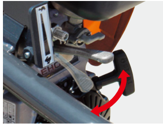
●操作しやすいスロットルレバー