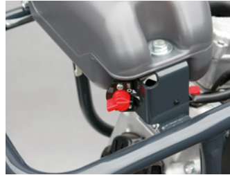
●手元に配置したエンジンストップスイッチ